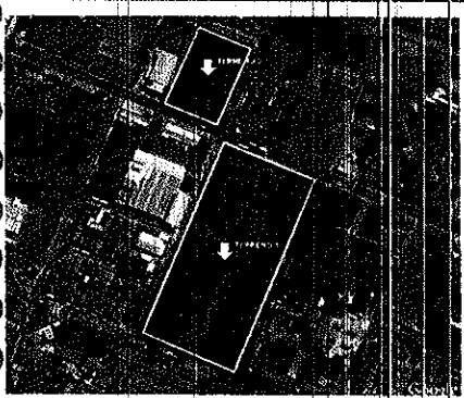
Terrenos 01 e 02

Secretaria Municipal de Desenvolvimento Urbano e Infraestrutura - SEINF